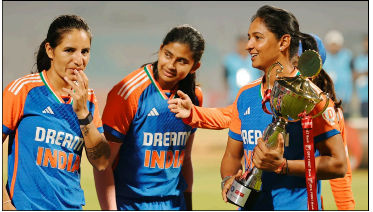
মহিলা টি-২০ শৃংখলাত ৱেষ্টইণ্ডিজৰ বিৰুদ্ধে জয়ৰ অন্তত ট্ৰফীসহ ভাৰতীয় দলটোৰ খেলুৱৈসকলৰ একাংশ