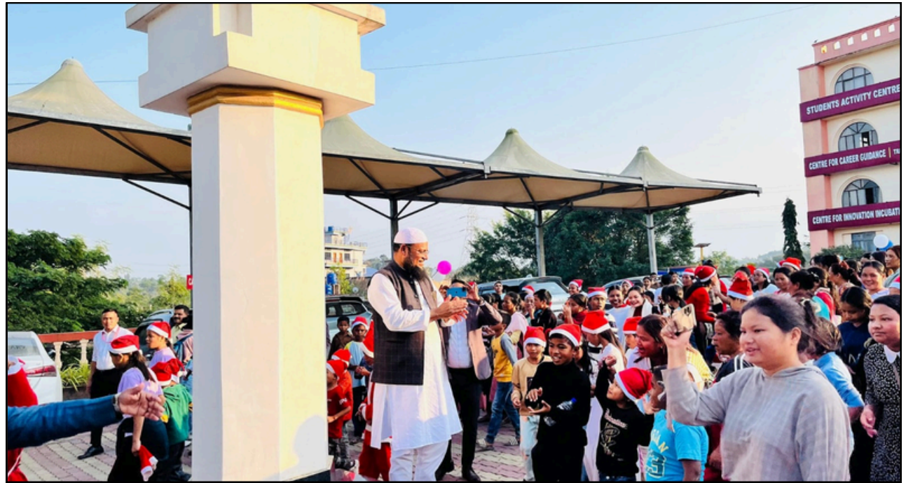
ইউএছটিএমত এনেদৰে পালন কৰিছে প্ৰাক-বৰদিন, বৃহস্পতিবাৰে