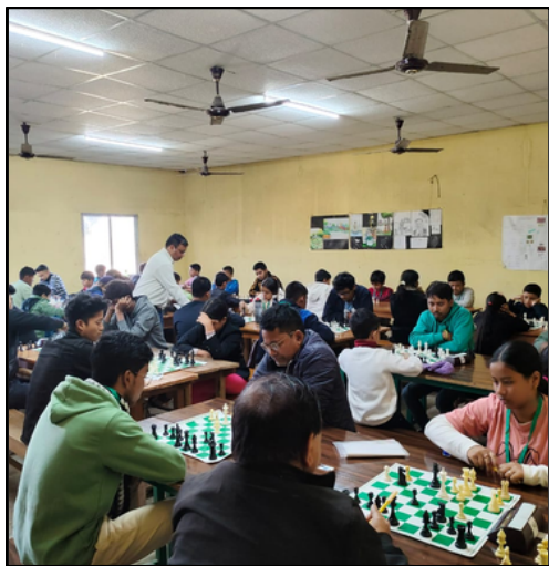
মিৰ্জাৰ দবা প্ৰতিযোগিতাৰ এটি দৃশ্য